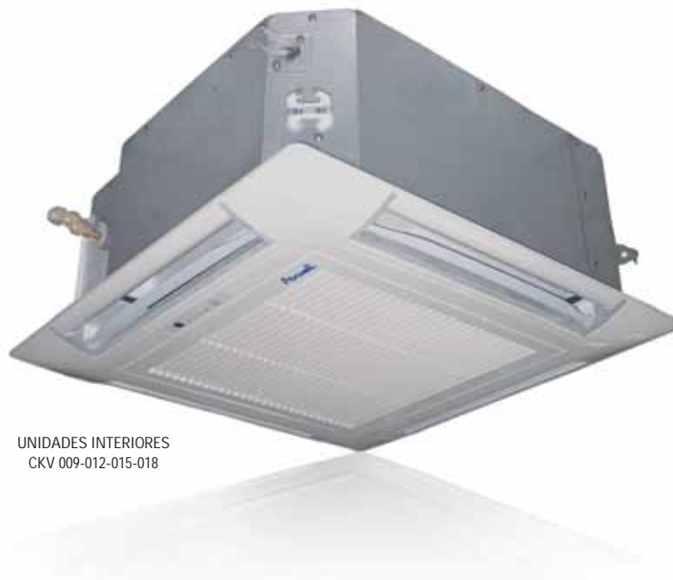
UNIDADES INTERIORES CKV 009-012-015-018

4 modelos bomba de calor de 2,8 a 5,6 kW